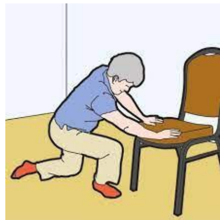
Kłęk lub wstawanie