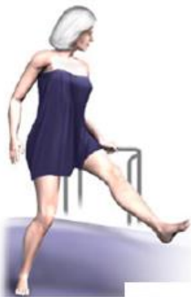
Wychodzenie z wanny